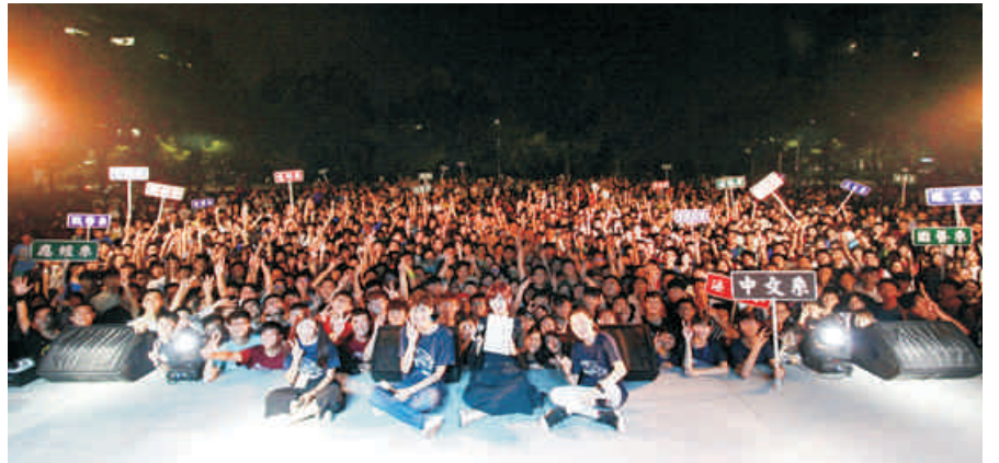
▲ 熱鬧又溫馨的晚會