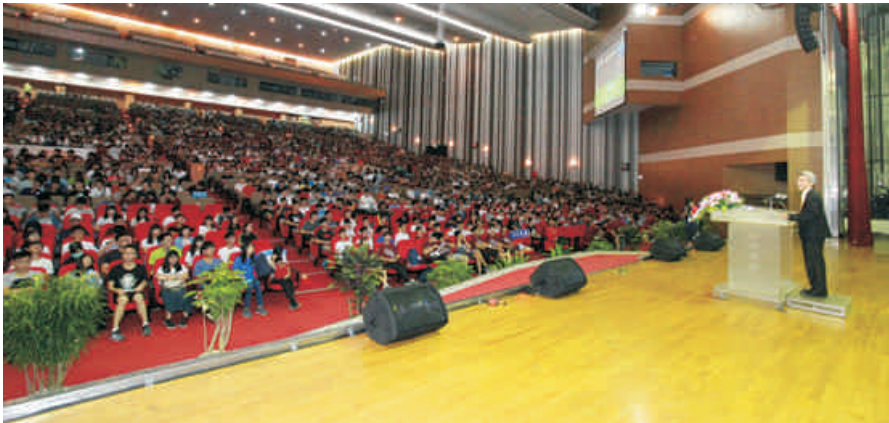
▲ 校長於始業典禮勉勵新生

另為強化學生衛生保健機制及生涯規劃，特地於9月6日至9月7日與署立台中醫院合作在校內提供新生優惠健檢與保健諮詢服務，並且也針對新生辦理數場生涯講座，期待藉由以上措施，能夠讓新生在報到後的第一週，即能夠感受到中興大學對學生「身心靈」全方位的照顧，讓新生能夠迅速蓄積未來4年的學習能量。