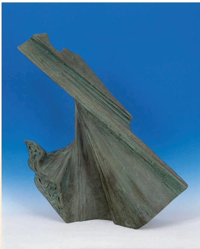
▲圖二：楊英風《水袖》，雕塑。

興大藝術中心於民國七十七年成立，為全國大學首創，除籌辦藝術展覽、推廣美術教育、文化交流與協助校園美化外，「典藏」也是重要核心之一，經過多年努力，各類藝術藏品已逾千件，豐富多元，此次分舉攝影名家張敬德、臺灣公共藝術先驅楊英風及道之畫楊秋忠作品賞析，帶領觀者進入藝術的殿堂，了解藝術家生平，將專業融合創作，達到獨有藝術風格。