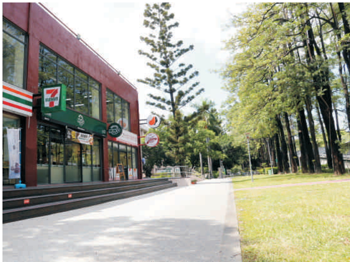
▲ 綠意優雅，校園社區通透共享。

中興大學重新改建的學生餐廳「圓廳」被譽為全台最狂的校園餐廳，除了知名品牌進駐的8間主題餐廳外，也有中、美、日、義、韓、泰、日式等各國料理的美食街供選擇。4月試營運至今，每日湧進2千人次的用餐人潮，頗受好評。9月25日上午圓廳舉辦開幕式，並有摸彩與打卡送好康活動，現場熱鬧滾滾。