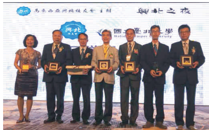
▲ 2018年第44屆興北之夜聯誼晚宴