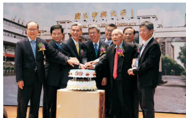
▲興大99歲生日，副總統陳建仁(左4)、興大校長薛富盛(左3)與大校友總會理事長蔡其昌(左5)、台中市秘書長黃景茂(左2)、興大前校長貢穀紳(右3)、彭作奎(左1)、蕭介夫(右2)共同切蛋糕

隨著餐會進入尾聲，校長更是獻唱一首【外婆的澎湖灣】，也讓餐會在校長美妙的歌聲中圓滿落幕。