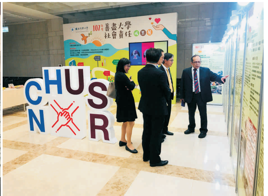
▲ 善盡大學社會責任成果展