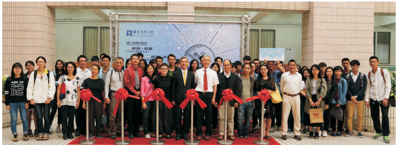
▲ 興光閃閃教學成果採收季