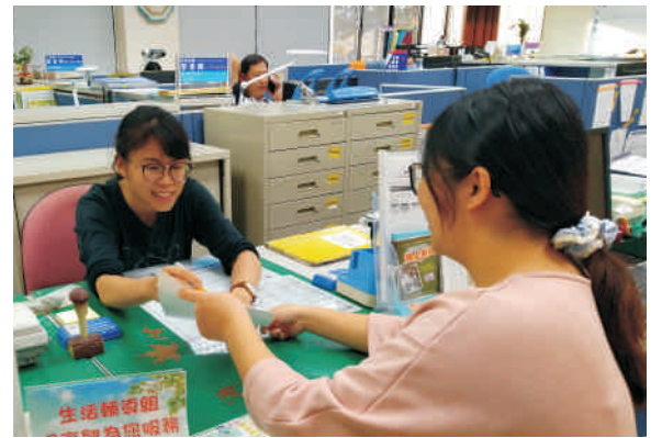
▲ 生輔組有豐富的助學資源和充滿熱忱的服務同仁，協助本校弱勢學生順利就學

◎107學年度第2學期學雜費減免在校生辦理時間為107年12月24日至108年1月4日。