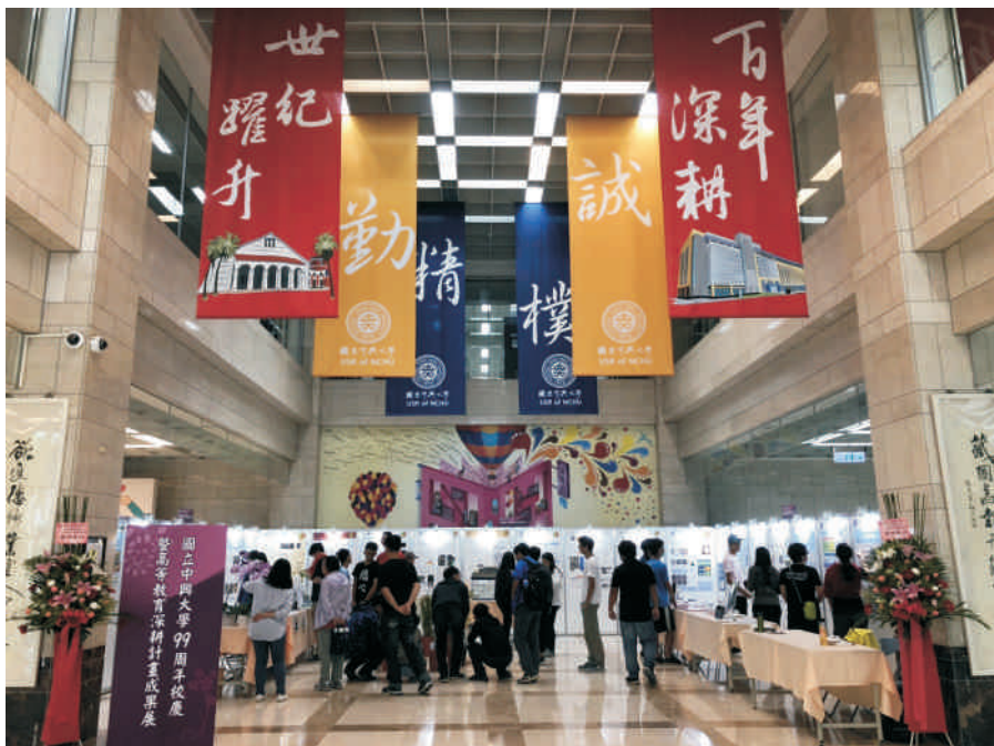
▲ 高等教育深耕計畫-特色領域研究中心成果展