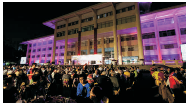
▲海內外校友共襄盛舉席開108桌