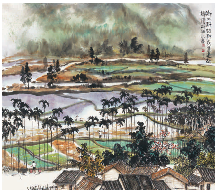
▲ 《斯土斯物斯民盡是故鄉情》，90x109.5cm，2009。