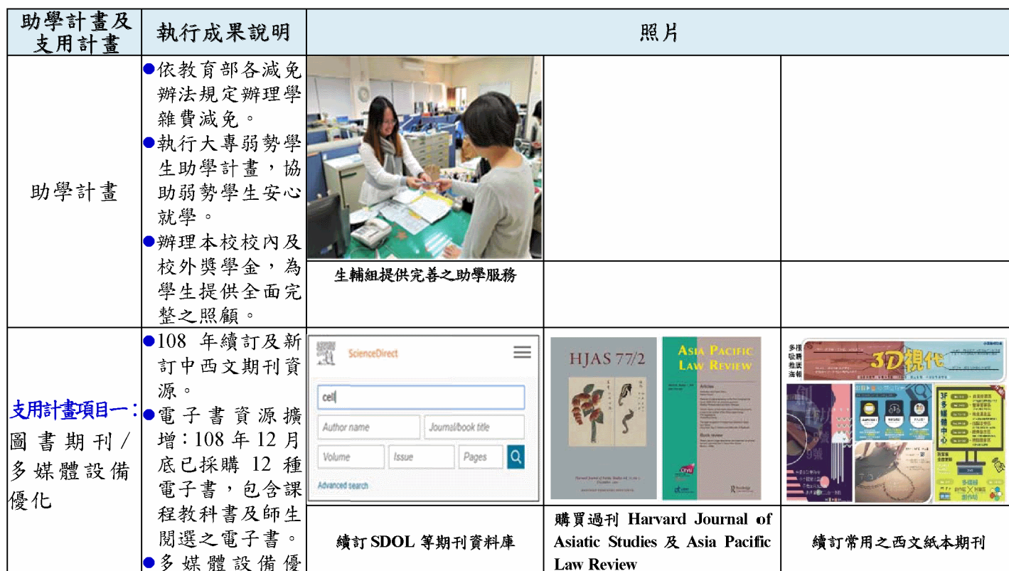
【表 3】108 年度下半年助學計畫及支用計畫執行成果照片(節錄)