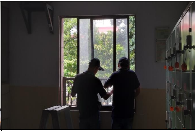
說明：窗框變形，無法關閉，更換窗戶