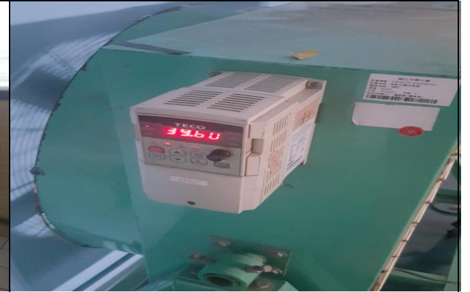
說明：體育館 B1 風扇維修