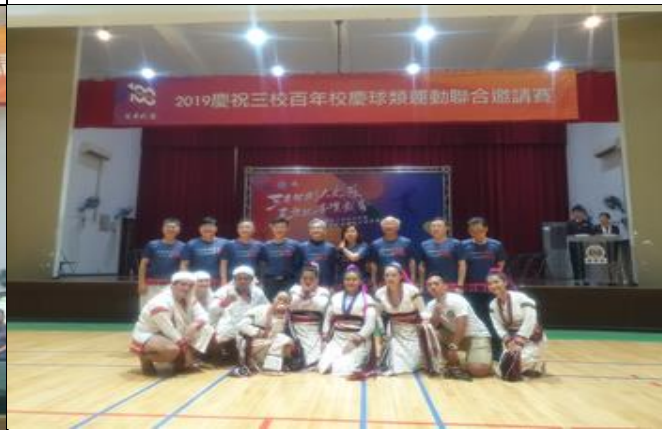
說明：中市三所百年學校舉辦聯合運動會