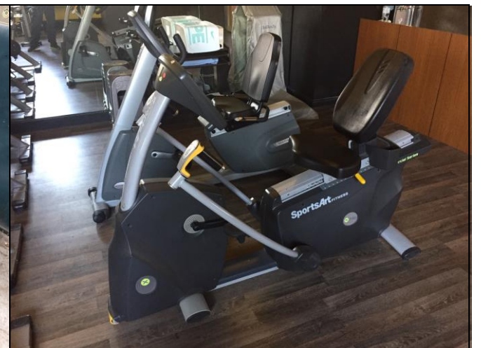
說明：健身房器材維修與保養