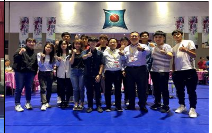
說明：百年校慶僑生校友活動