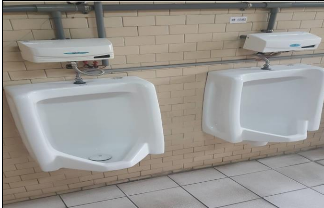
說明：體育館男生廁所零星修繕