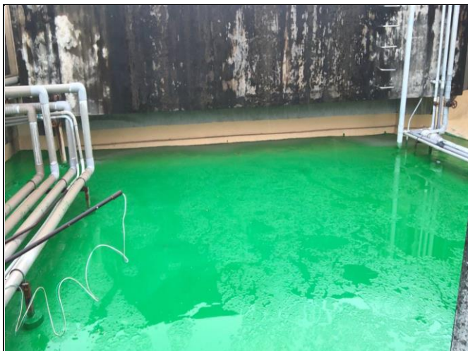
說明：體育館屋頂防水工程