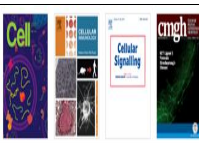
說明：訂購各系所所需之核心期刊