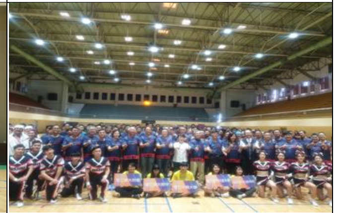
說明：中市三所百年學校舉辦聯合運動會