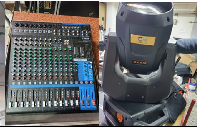
說明：學生活動用混音機及搖頭燈