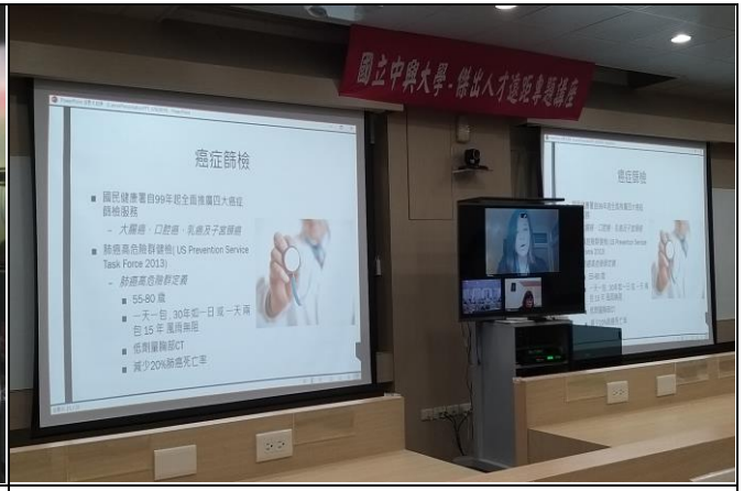
說明：維護教學設備，辦理國外校友遠距活動