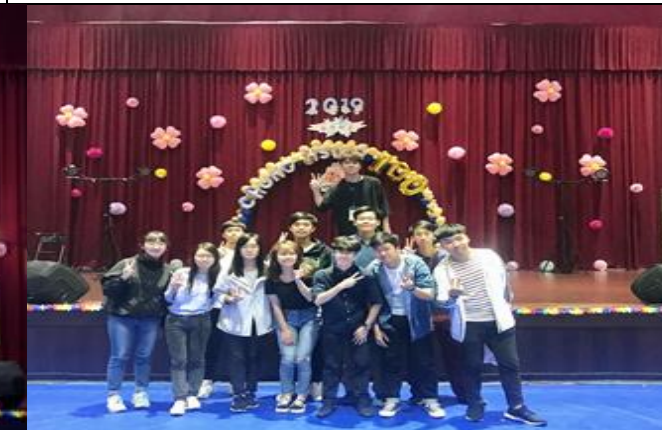
說明：百年校慶僑生校友活動