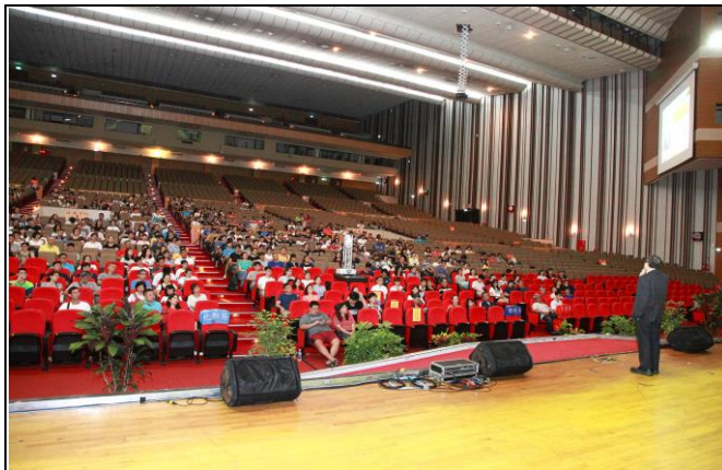
說明：黃副校長主持校級新生家長說明會