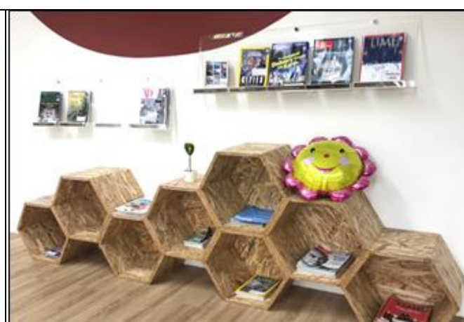
說明：續訂常用之西文紙本期刊