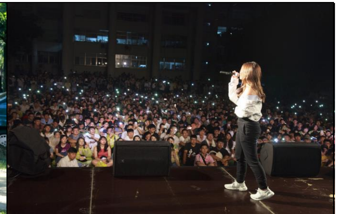
說明：新生入學指導(新生晚會)