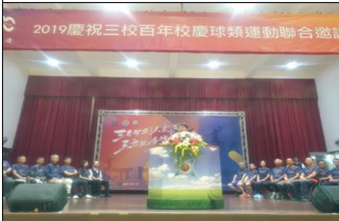
說明：中市三所百年學校舉辦聯合運動會