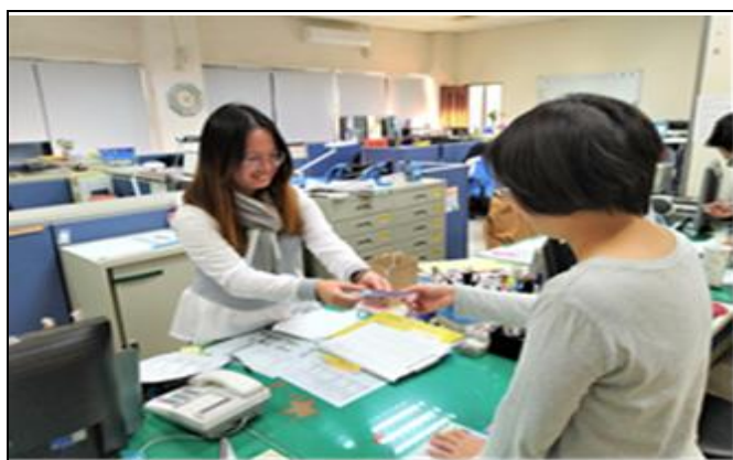
說明：生輔組提供完善之助學服務