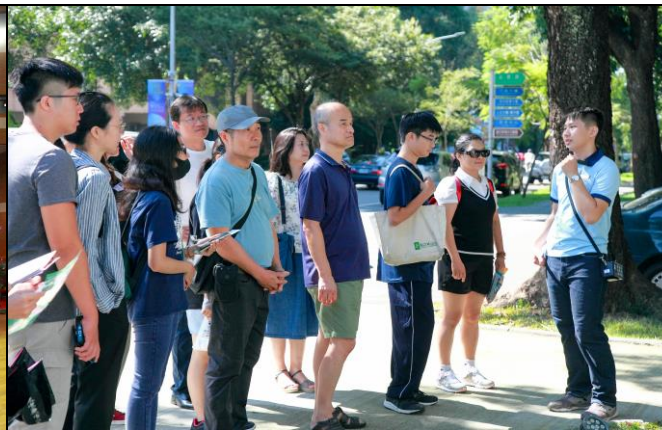
說明：新生家長校園導覽