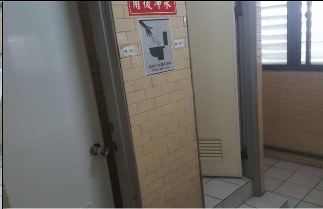
說明：體育館女生廁所零星修繕