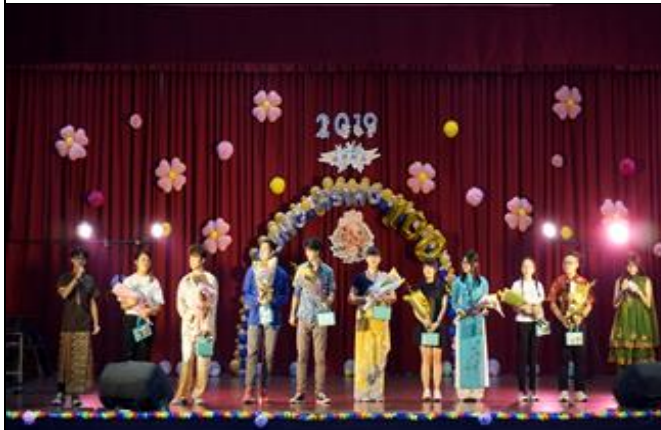
說明：百年校慶僑生校友活動