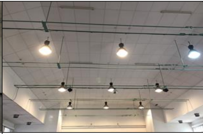
說明：小禮堂更換 LED 燈