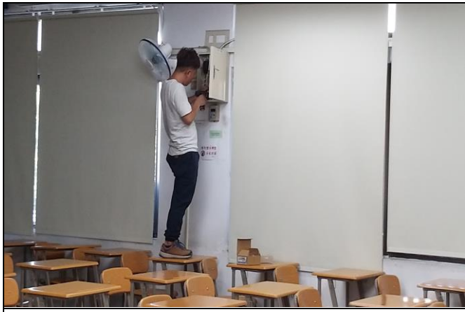
說明：更換冷氣機電錶