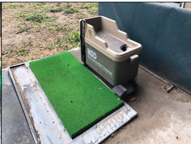
說明：維修高爾夫球送球器及打擊草皮更新