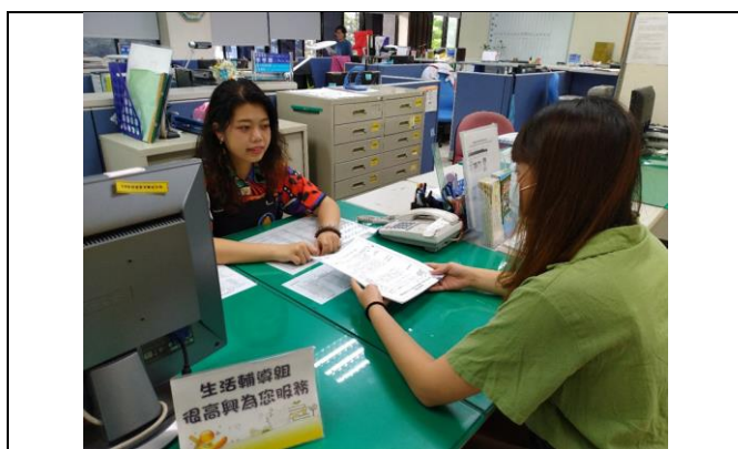
生輔組提供完善之助學服務