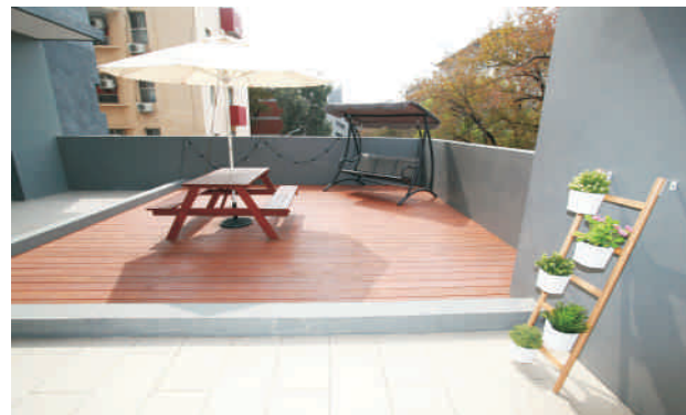
▲ 誠軒的露天陽台為開放式休憩空間，設有搖椅與陽傘等設備，提供同學悠閒自在的生活場域。

誠軒公共空間規劃有小廚房、露天陽台區、閱覽室等，小廚房內部配有烹調家電用品，滿足同學下廚烹飪的期待，也設有木質吧檯區、桌椅休憩區；露天陽台設有搖椅與陽傘等，提供住宿生悠閒自在的生活場域。