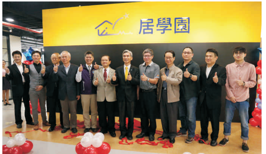
▲ 興大居學園啟用 600坪大空間供學生使用

興大校長薛富盛表示，期盼透過建置好的學習環境，激發學生的學習熱情，希望居學園啟用後，學生能善用空間，發揮潛能。