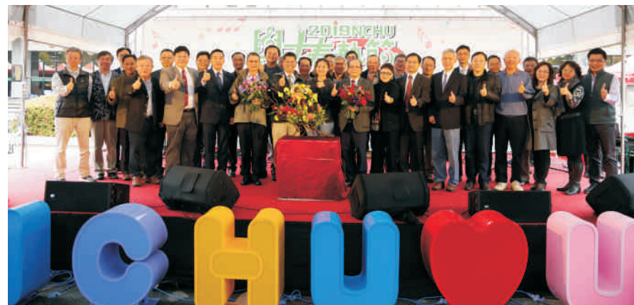
▲ 春蟄節貴賓及長官大合照

除系所博覽會，也同時辦理模擬面試、多元社團、國際美食、學生市集、租屋博覽會、反毒宣傳、圖書館前的寵物健檢等活動，今年是本校第四年辦理興大春蟄節，每一年的第一聲春雷響起我們就知道春回大地了，春天將為大地帶來了生機、帶來了生氣，因此春天這個時節，容易讓人心情喜悅並充滿希望，期待讓現在的高中生，也就是我們未來的大學生，對各個學系學習方向及未來發展有更好的了解，也期待透過這樣的活動，跟各高中及高中生有更緊密的連繫！