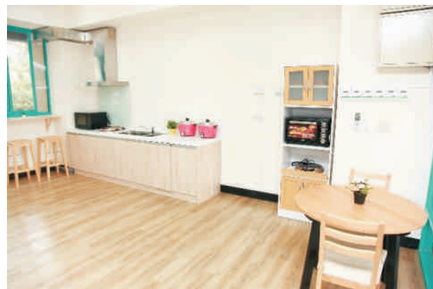
▲ 誠軒的小廚房內部配有各式烹調家電用品一應俱全，滿足同學下廚烹飪的需求。

過去女生宿舍僅有四棟宿舍，由於床位數不足，常供不應求，為照顧更多莘莘學子住宿需求，學校規劃了女宿新宿舍誠軒，終於在107年10月22日正式落成。目前女生宿舍共有五棟宿舍，可提供2248床位供學生住宿。