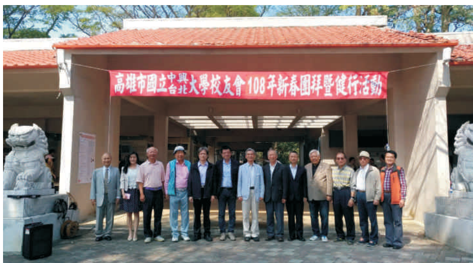
▲圖為校長與校友中心主任與台北大學校友會成員合影