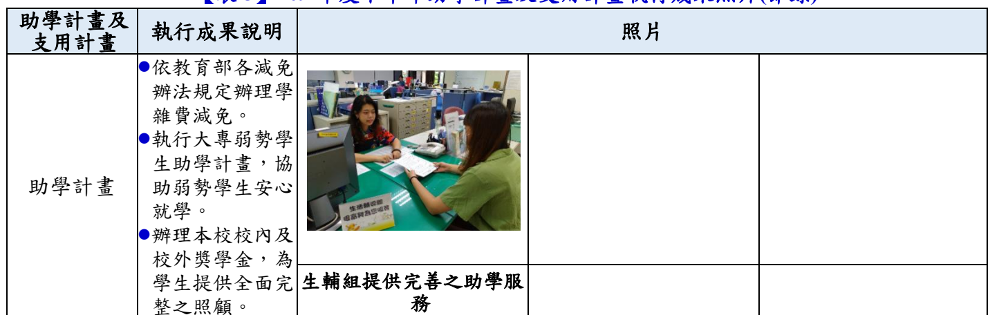
【表 3】109 年度下半年助學計畫及支用計畫執行成果照片(節錄)