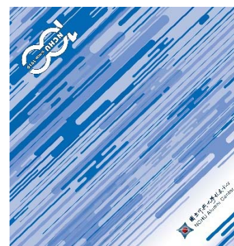
萬用方巾(57cm x 58cm)