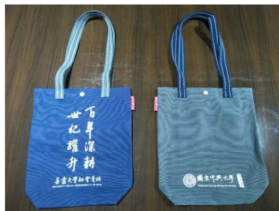
手提袋(29cm x 33 cm, 藍色、鐵灰色)