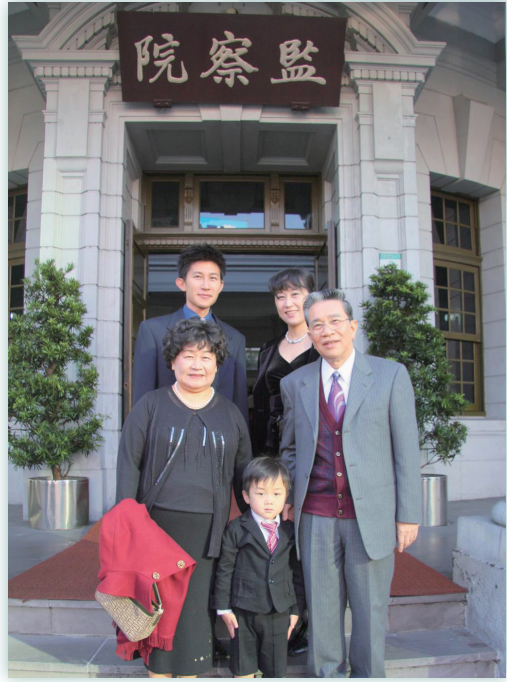
在監察院正門與家屬合影