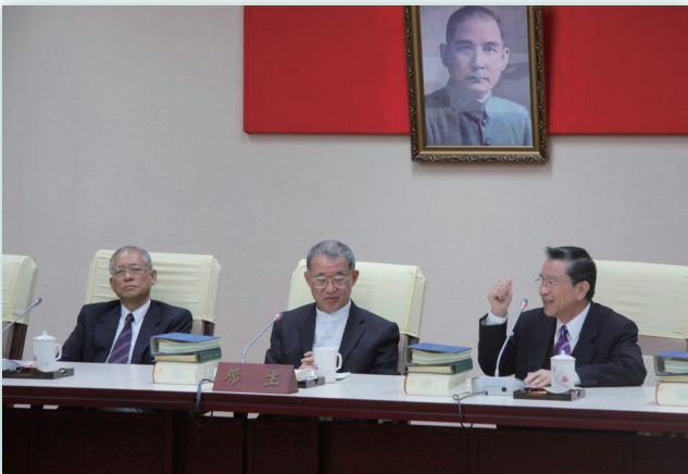
巡察行政院記者會上答詢現況