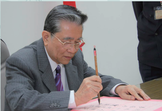
宣誓就職後簽名報到