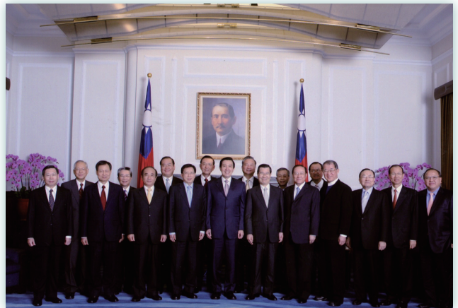
定期參與總統府暨五院三長之交流活動