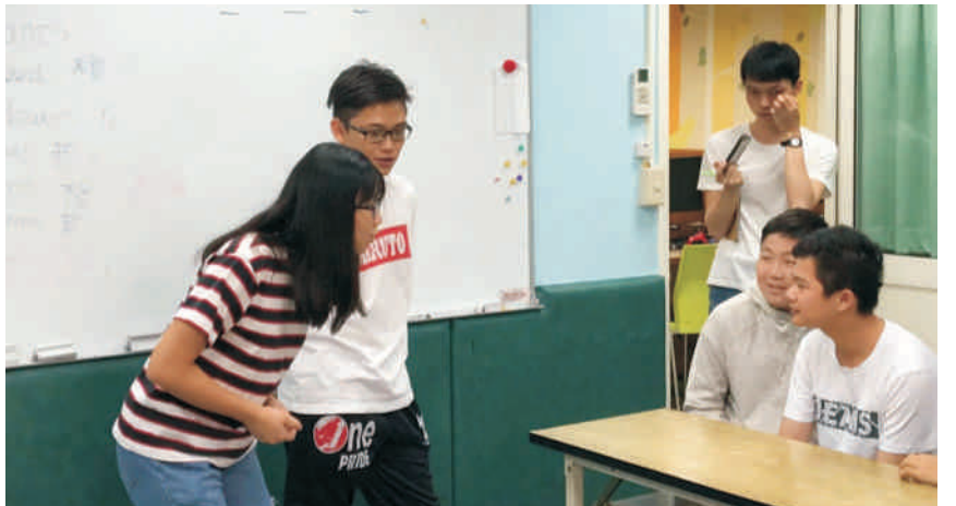
▲ 僑生們認真的進行英文輔導教學

僑生都給與此活動正面的評價，透過教育志工服務，學習到很多，也為台灣盡一份微薄的心力。