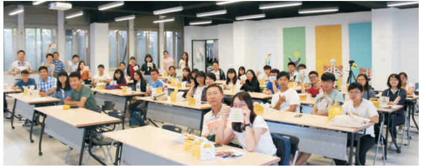
▲ 花博導覽志工成果分享會