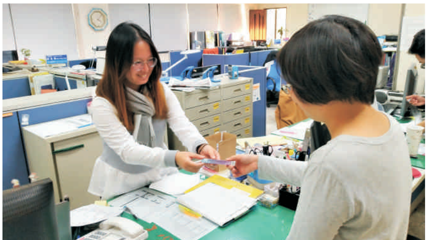
▲ 生輔組有豐富的助學資源和充滿熱忱的服務同仁，協助本校弱勢學生順利就學