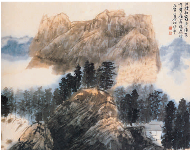
▲ 圖3：江兆申水墨〈山水〉