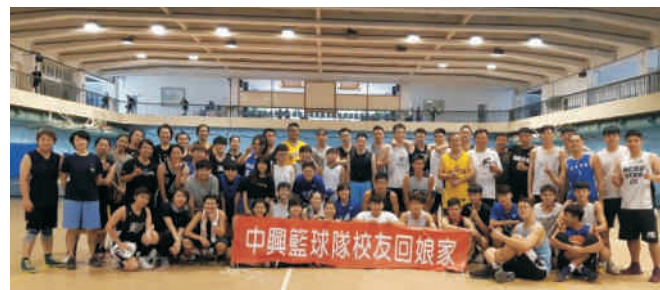
▲ 5/4於中興大學體育館籃球場舉辦一年一度中興大學男、女籃代表隊校友回娘家活動