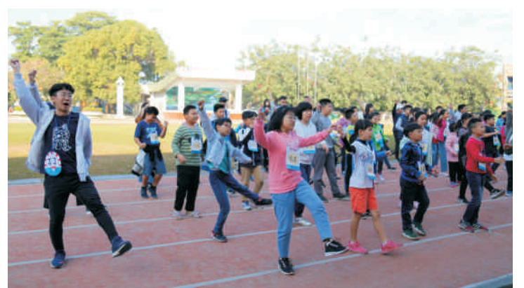
▲ 高雄地區校友會帶著小朋友一起做早操讓一天有個活力的開始

動，讓孩子們不單單只是坐在教室裡聽課，還安排團體合作活動，可以學習團隊互助合作的重要。