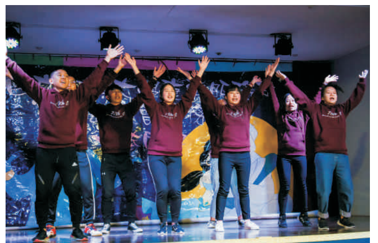
▲ 康樂服務社於營隊期間準備晚會節目與小朋友及家長們同樂

桃園地區校友會前往桃園市楊梅區舉辦返鄉服務隊，課程內容包羅萬象，有借位攝影、認識台灣、世界文化、科學實驗及美食DIY等，同時還有團體遊戲活