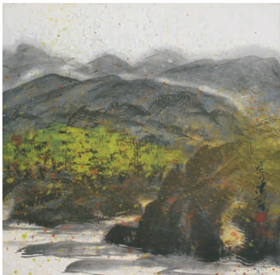
▲ 《山水情懷》，70x70cm，2010。 (寧可先生展後捐贈興大典藏作品)