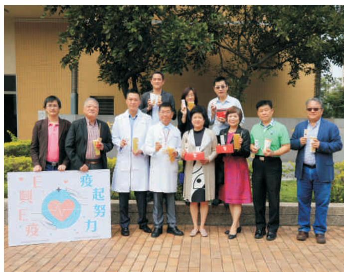
▲ 興大管理學院EMBA與企業捐贈防疫物資，一同守護度過疫情

此次送暖活動除了獲得EMBA校友會與EMBA學生會支持外，響應企業包含1969藍天飯店、六暉控股股份有限公司、元大營造有限公司、甲文青茶飲、永?營造股份有限公司、全光武玻璃有限公司、亞格廣告有限公司、弘旺藥品有限公司、吉嘉電子股份有限公司、佳燁精密鑄造工業(股)公司、佐登妮絲國際股份有限公司、魚中魚水族寵物有限公司、巢旅宿智能旅館、福盛製罐工廠股份有限公司、鈦騰複合材料股份有限公司、象元印刷事業股份有限公司、萬年清環境工程股份有限公司、億星鞋業有限公司、廣鐸企業有限