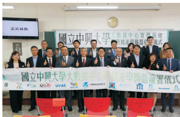
▲ 跨域產學聯盟啟動，產官學會員大合影