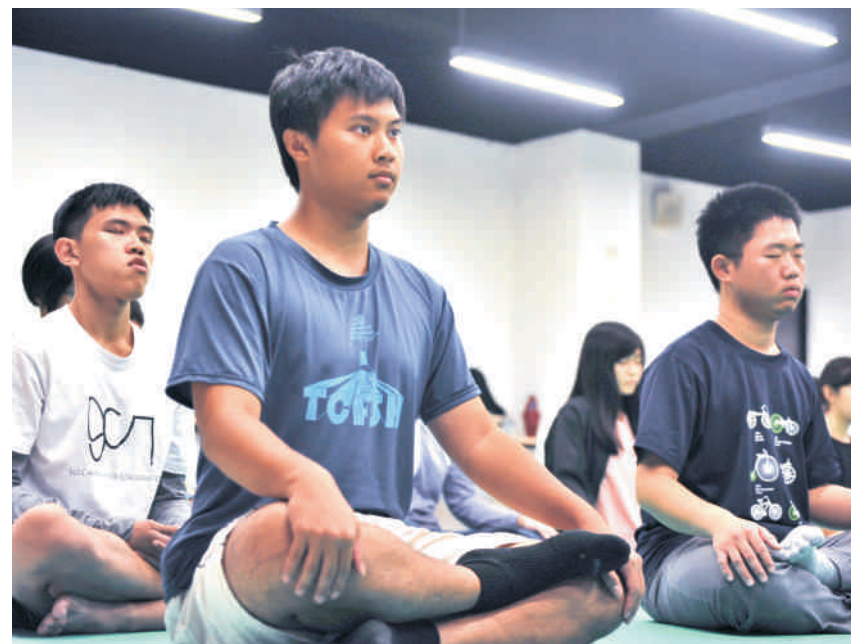
▲ 日常晨間、傍晚禪定端坐靜心