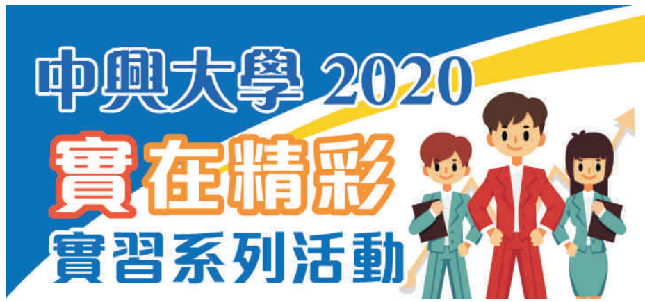
▲ 2020「實」在精彩職缺均已公告在活動網頁, 歡迎同學踴躍申請

中興大學2020「實」在精彩 實習活動網頁 http://nchu.cc/42P2Y