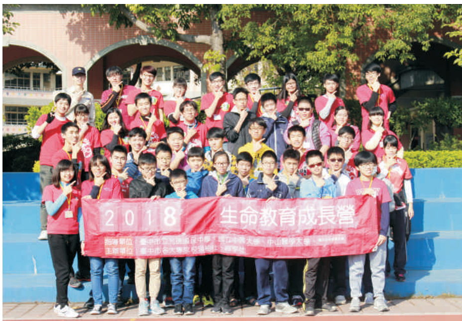
▲ 生命教育成長營-台中市光德國中梯次