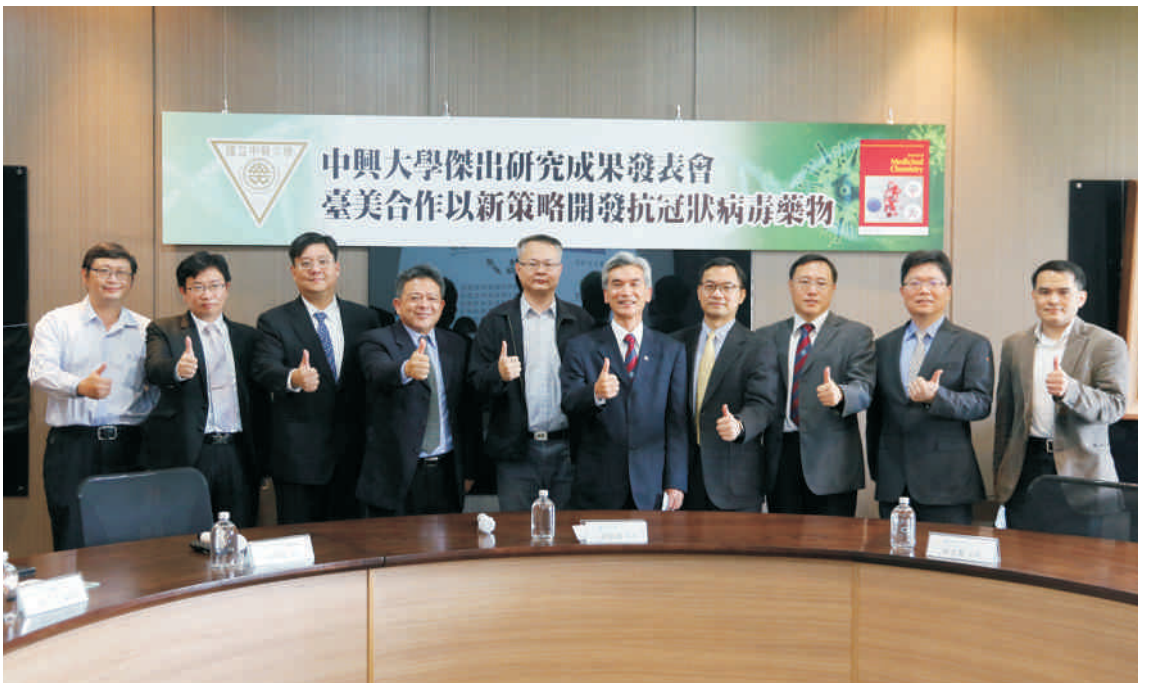
▲ 興大與美國合作 利用新策略開發抗冠狀病毒藥物

該研究由興大基資所侯明宏教授所領導研究團隊所執行，團隊包含博士後研究員林珊夢、簡啟民，碩士生許家寧、王永勝等。亦感謝美國喬