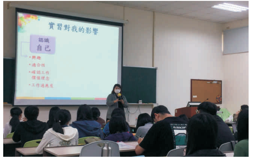
▲ 搭配實習活動, 辦理《實習對職涯發展的重要性》