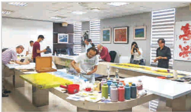
▲ 琺瑯書畫作品創作過程

以鋼板取代紙張、畫布，以琺瑯釉藥代替水墨、油彩，九位知名藝術家及琺瑯釉彩專家齊聚一堂，不同的書畫類型，同時揮筆創作，開拓了書畫材質表現的多樣性，更首創琺瑯與書畫的跨域合作以及戶外陳設展覽的模式。