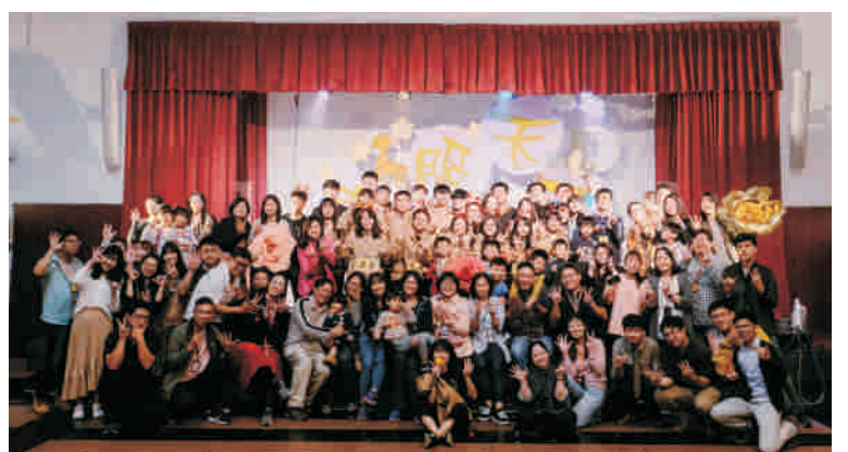
▲ 康服社歷屆社員同堂大會