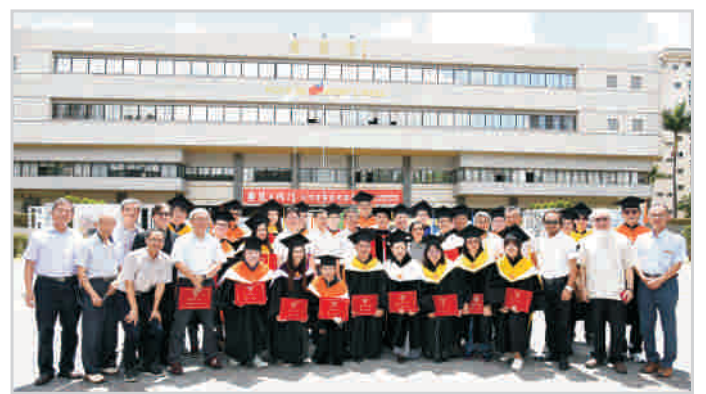
▲ 展覽開幕式與興大博士畢業生合影

寓意於展覽跨域創新的精神，琺瑯材料不怕風吹日曬雨淋的特質，祝福並期許中興畢業生們在開啟另一段旅程之際，不論未來面對職場的磨練或學術研究的艱辛，在順風逆境下都能有所突破，迎向挑戰，與風日同行。歡迎畢業生及家長、教職員工及社會大眾隨時蒞臨參觀，留下本屆畢業季獨特的回憶。