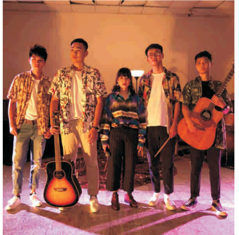
▲ 畢業歌MV劇照：『外包中堅商』樂團定照

此外，校長也特別為今年的畢業生舉辦了一場畢業季藝術特展(與風日同行-瑛瑛書畫藝術聯展)，展期自6月4日起至6月30日止。另外在6月4日開展當日學務處還特別規劃了博士生及學士班優秀畢業生與校長合影的活動，也歡迎所有的畢業生於展期間踴躍前往參觀、合影，在中興留下最特殊的回憶。