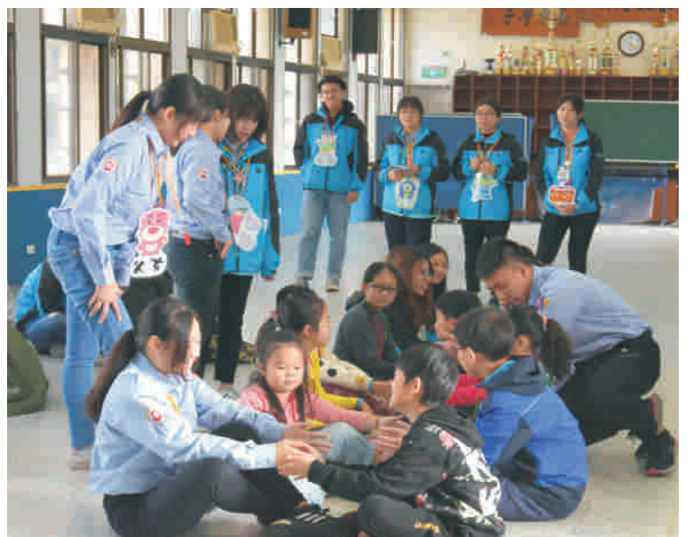
▲ 康服社寒假服務隊與小朋友同樂