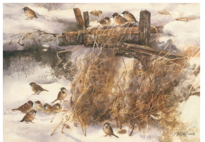
▲傾聽島嶼系列~心靈時空，水彩，78x110cm，2017。