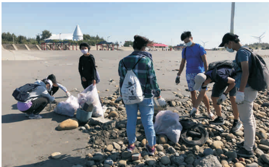
▲ 大安濱海公園淨灘活動

想聽聽大自然的有趣故事嗎？想認識中興湖的生態嗎？或是想要為生態保育的推廣盡一份心力？讓自然生態保育社來告訴你，還有更多好玩又有趣的社課以及活動在這裡等著你喔！熱情邀請同樣熱愛自然的你！加入我們，一起踏入大自然的擁抱！