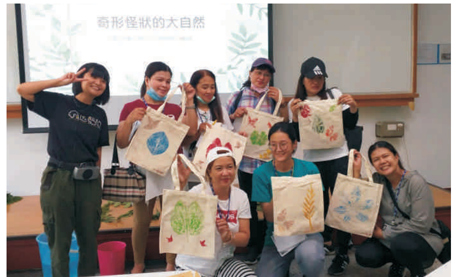
▲ 協助大屯新住民中心辦理自然生態推廣活動