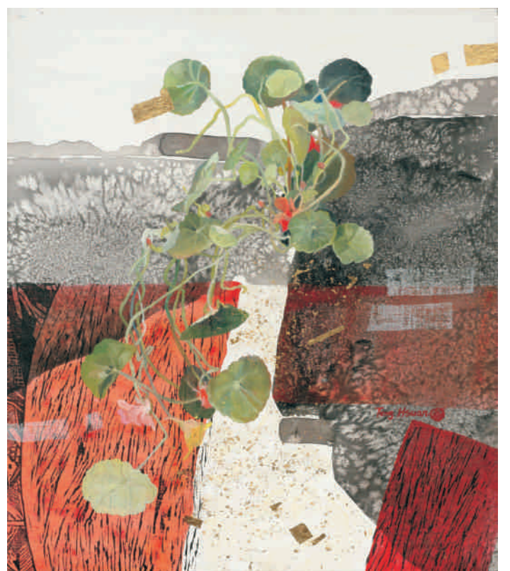
▲生命素描系列~自然的片段，壓克力、版畫、金箔，10F，2018。