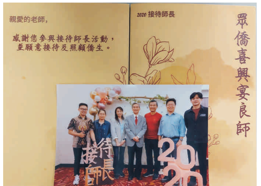
▲ 僑生特別設計一個拍照牆，讓師長與被認輔的僑生合影留念留下溫馨的回憶，並立即列印裝訂成感謝卡送交師長。

此次活動除了享用佳餚，同時也安排了一系列的僑生表演節目，僑生聯誼會的四大同學會動員同學表演各個僑居地的傳統歌曲及舞蹈，值得一提的是，僑生們特別設計了拍照牆，讓師長與被認輔的僑生合影留念留下溫馨的回憶，並立即列印成感謝卡送交師長，期待明年更多師長們共襄盛舉。