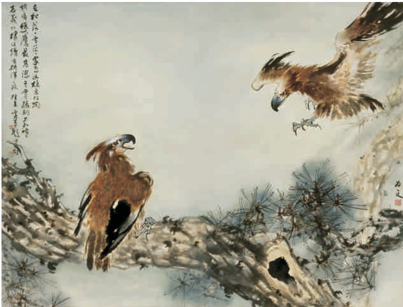
▲許志義教授(資管系)與父親皆師從嶺南派歐豪年大師，此次展出水墨巨幅畫作〈雙鷹〉，寬180公分、長276公分，是教授1983年創作於夏威夷，圖上有歐豪年老師的題字，彌足珍貴。(興大藝術中心典藏，現裝置於圖書館七樓第一會議室)

彩、版畫、攝影、工藝、數位設計及影像藝術等皆囊括其中，從學齡前幼童至八十歲長者皆有精采呈現，可見同仁繁忙業務外，以藝術調劑身心，同時提供眷屬作品支持校內創作展，達到「藝術即生活」的具體實現，藝采紛呈，歡迎蒞臨共賞。