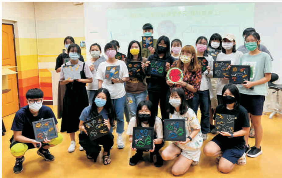
▲ 111第1學期「大線身手！冷光霓虹燈工作坊」

為強化全體校園對健康”心”生活的重視，學務處健諮中心每學期策畫「興健康講堂」活動，涵蓋健康飲食與運動、紓壓與健康生活經營等主題，以講座與實作推出相關活動，例如：電影賞析、生命教育講座、健康飲食、急救訓練、水彩暈染、釘子畫、輕艇、高爾夫球、游泳等，內容精彩可期，歡迎師生踴躍參加。