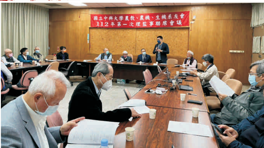
▲參加農教、農機、生機系友會暨112年理監事會議

捐款芳名錄公告於本校捐款網站( http://gve.nchu.edu.tw/ )。