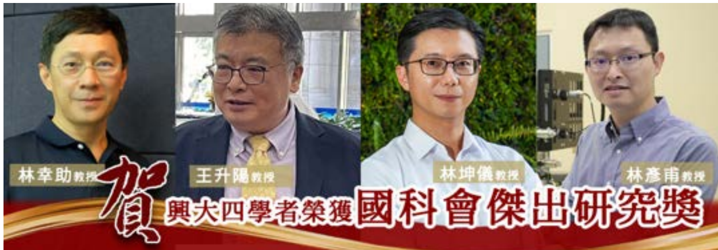
▲ 興大四名教授榮獲國科會傑出研究獎 頂大僅次於台清成

興大詹富智校長表示，興大雖然以農立校，在校方全力支持及同仁積極努力下，各領域各擅勝場，蓬勃發展。此回分別來自理、工、農、生學院四位教授優異學術成就獲國科會傑出研究獎，亦是對興大全面學術卓越最佳肯定。目前校內有多位中生代表現相當亮眼，期許未來會有更多同仁能展露頭角，為校爭光。