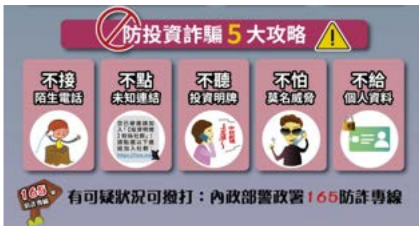
▲ 防投資詐騙5大攻略