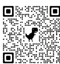
▲ 興大四健會社團FB連結