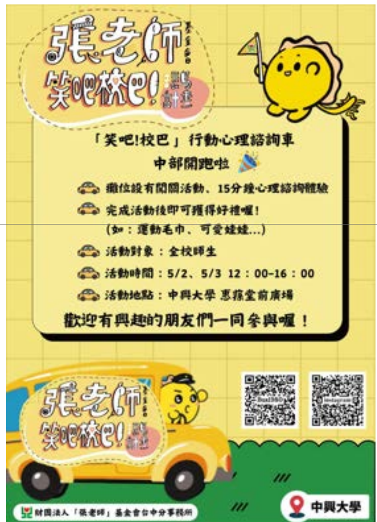
▲ 全台巡迴的「笑吧！校巴」，即將在五月停靠興大站，歡迎同學上車，讓「笑吧！校巴」把你的煩惱載走吧！

「笑吧！校巴」沿途經過許多美麗的風景，將於5月2~3日抵達興大惠蔭堂前廣場。歡迎學生前來玩玩扭蛋機及摸彩贈送禮物，並體驗心理諮詢，和「張老師」分享自己的困擾和煩惱，了解問題所在並傾聽自己的心聲。