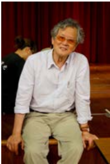
■ 展出藝術家/黃春明

借用自黃春明老師筆名之一「春萌」與他的散文《等待一朵花的名字》，中興大學四月將以「春萌花開：春天樂讀黃春明」為題，展開一系列藝文活動，體現黃老師數十年創作生涯中各類作品的生命力，也能讓大眾進一步認識國寶級文學大師黃春明對臺灣文學與文化產生的重要影響。