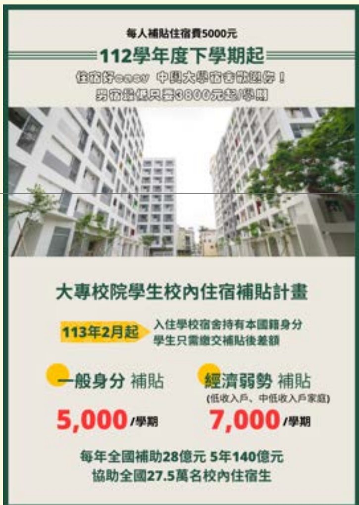
▲ 校內住宿補貼宣傳

教育部自113年實施「大專校院學生校內住宿補貼」方案，補貼公私立大專校院入住學校宿舍(持有本國籍身份學生)，住宿生每名每學期補貼5,000元，如屬低收入戶或中低收入戶家庭者，每名每學期補貼7,000元。