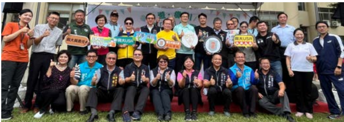
▲ 興大USR計畫「遊綠川從興出發」

，凸顯興大在社會責任履行方面的卓越成就和領導力，期盼能為臺灣的水環境保護和社會發展帶來更多積極影響。