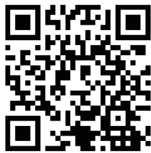
▲ 活動資訊 請關注健康及諮商中心網頁

學務處健康及諮商中心致力於營造正向友善的校園環境，每學期皆規劃「興健康講堂」系列活動，旨在關懷學生族群的身心健康。活動涵蓋心理與生理健康促進相關議題，透過講座與實作課程等多樣形式呈現。例如：牙科與眼科知識、急救技能訓練、愛滋病與自殺預防、療癒手作、壓力調適與人際界限、認識身心障礙族群、減重心理學與體重控制課程等。不僅具有豐富的知識，還有助於學習自我照顧，歡迎師生踴躍參加。