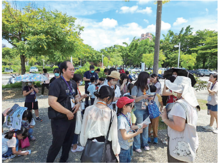
▲ 家長與孩童共同解鎖任務