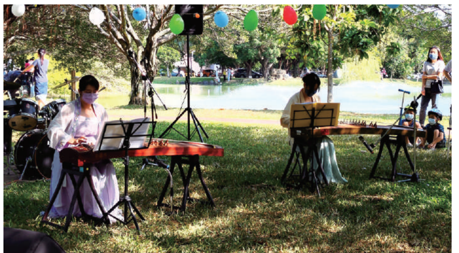
▲ 2022中興企管湖畔咖啡音活動演出

最後，歡迎所有對古箏有興趣同學加入清韻古箏社，無經驗亦可，一起將大學生活變得多彩多姿。