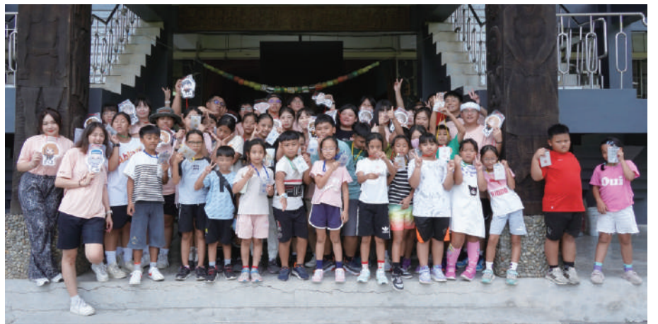
▲ 113年暑假社會服務隊-原漾社屏東三地門青葉國小

中興大學寒暑假服務隊的傳統歷久彌新，在這數十年間，活動不論風雨照常舉行，在嚴峻的疫情過後，重新整隊出發至臺灣各地偏鄉小學辦理營隊，繼續將服務的精神行腳至臺灣各個角落，所堅持的理念就是不讓偏鄉的學習機會落空，能在別人的需要上看見自己的責任，實現成己達人的理想。113年暑假服務隊共計5個隊伍，有由學生事務處課外活動組與原住民族學生資源中心合辦的原鄉聯合服務隊，邀請本校原住民學生以及來自各系所的非原民同學一起加入，還有應用經濟系農村服務隊、康樂服務社、崇德青年社及兒少教學新創服務社，共計100位興大熱血青年出隊服務。