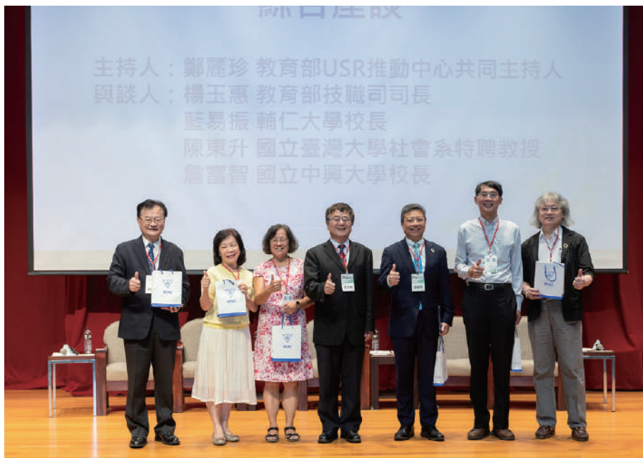
▲ 與會座談貴賓，左至右：教育部USR推動中心蘇玉龍總主持人、教育部技職司楊玉惠司長、教育部USR推動中心鄭麗珍共同主持人、興大詹富智校長、輔仁大學藍易振校長、臺大社會系陳東升教授、教育部USR推動中心陳竹亭協同主持人