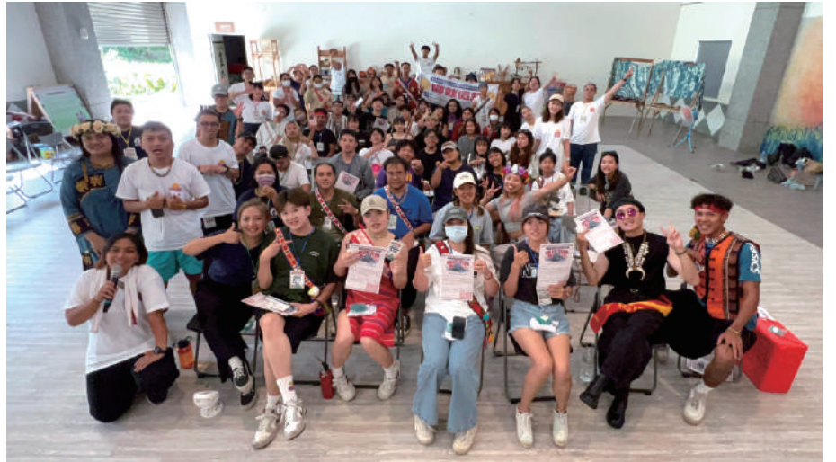
▲ 中區大專校院原住民青年領袖培育營-閉幕式照片

本次營隊特別聯合南區區域原資中心辦理，共11校一同辦理，策劃營隊活動，促進團隊合作之學習，建立中、南區域內良好的跨校交流。營隊課程也與當地協會(羅娜社區發展協會)連結，學習文化同時，更好地回饋部落。