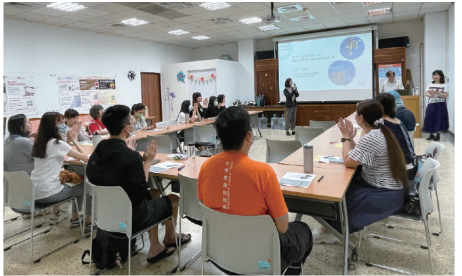
▲ 112第2學期「地球人請聽我說-關於自閉症你該知道的五件事」，透過自閉症者在生活中實際發生的故事，認識他們的特質、發掘他們的可愛之處。