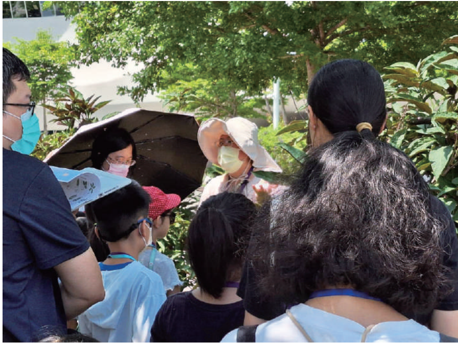
▲ 家長與孩童認真聽講

好奇心，小遊戲與團隊積分賽，也讓家長與孩童共同沉浸於解鎖任務中。植物是理性的一門科學，透過人與植物的互動，能產生正向的關係效應，園藝、植物療育能為不同年齡層帶來福祉。