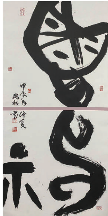
▲ 鹿鶴松甲骨文書法《暢神》