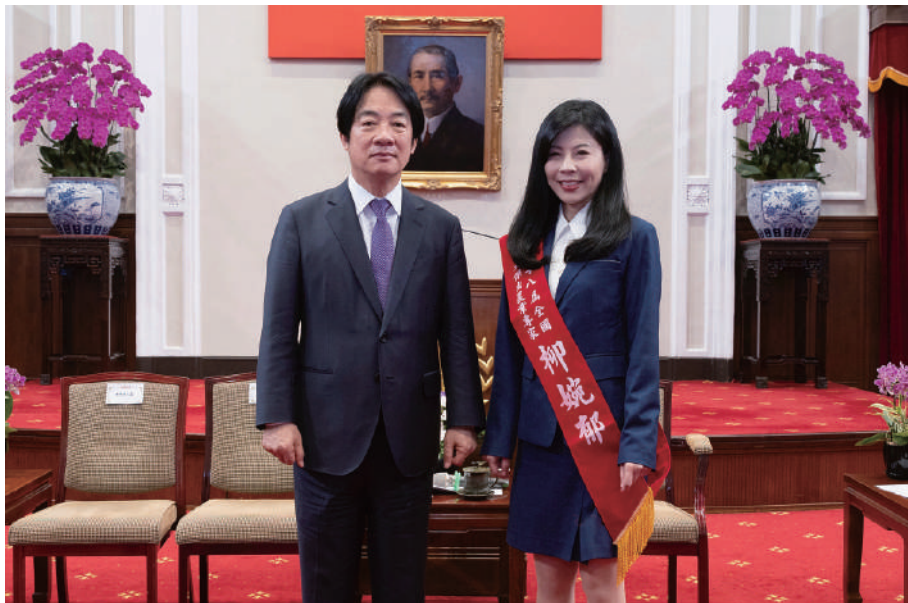
▲ 興大森林學系柳婉郁特聘教授(右)榮獲第48屆全國十大傑出農業專家，日前獲賴總統接見。