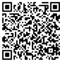
▲ 人格特質線上答題

凡答題滿分者，即可參加抽大獎活動!鐵三角藍芽耳機、富士拍立得、無線鍵盤滑鼠組等眾多好禮~等您來抽!