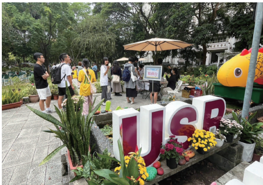
▲ 國產花卉課程設計

15日起展出學生於園藝療育專業領域之研究成果；16日由園藝系吳振發教授等共同編著之「花語幸福×園藝療育：24節氣認知促進手作」新書發表；17日「2024園藝療育研討會」盛大辦理，並進行「2024園藝療育方案設計競賽」頒獎典禮，此次競賽約40組高中、職、大專院校及社會組參加，使大學社會責任與高中職、社會端銜接，並提供高中職學生多元學習機會，充分帶動大眾對園藝療育專業領域的認識與重視。