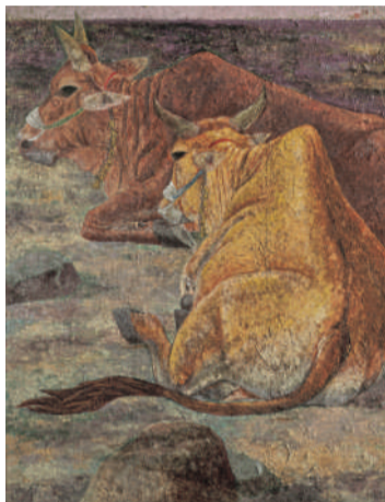
■ 上左：《憩息》，紙本膠彩，50F，1973。拉車、耕田從不說聲苦，只要給捆嫩草和涼水，就已經心滿意足了，今天難得偷個閒兒，躺在地上曬曬太陽，感謝飼主體諒。此圖畫紙嘗試應用棉渣紙，表現牛皮的粗糙質感，相得益彰，榮獲第27屆全省美展國畫第二部第一名。