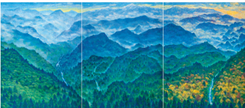
▲ 《玉山情懷》，紙本膠彩，240F（三連作），2011。玉山由東北朝西南綿互，是臺灣龍脊，千峯萬壑，氣象萬千，春嵐、夏岳、秋霞、冬雪，呈現山高雲低，四季變化，晨昏四時不同景觀，風情無限。以寫生為創作基礎，透過自然景物的幻化，體會出自然萬象的生機，感受四季風景、畫出不同的心境體悟。作品裡特別講究「彩」的自然多樣，體現厚塗法的魅力，親切中又帶著閒適優雅。畫者以寧靜祥和的筆調，來描繪人與自然的和諧平衡，由心故畫，畫下心中所感。

典型在夙昔，曾得標老師膠彩創作深受林之助教授啟發，在積累深厚底蘊之餘，更熱於嘗試創新，用色精練，善用