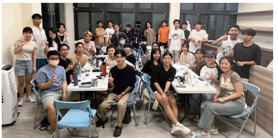
▲ 第一堂社課<手沖>大合照

下學期將進一步深入咖啡的技藝與風味，安排前往「迴咖啡」實作，學習進階手沖技巧與義式拉花，讓成員創造出充滿美感的作品。在咖啡研習社不僅分享技藝，更在每一杯咖啡中品味片刻寧靜，結交志同道合的朋友。