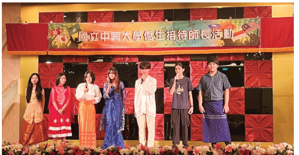
▲ 馬來西亞新進僑生於活動中獻藝

希望每位新進僑生在興大的求學生涯中都不再害怕嘗試新生活、新環境，可以鼓起勇氣勇往直前、迎接挑戰。過去曾經被師長照顧過的學長、姊們也能藉此機會對認輔師長表達感恩