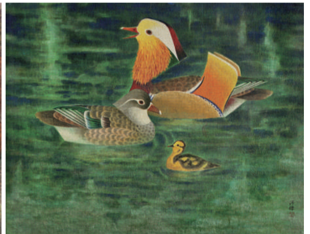
■ 上右：《闔家歡》，紙本膠彩，50×65cm，1990。水影波動，鴛鴦合家一起游，彩羽鮮麗天自來，歡喜慶團圓。

技法營造氛圍，獨具風格，期望大家透過畫作，親近並認識膠彩藝術與媒材特色，同時感受曾老師「筆下山川寫精神」的大師風範，歡迎蒞臨共賞！（展覽期間，藝術中心規劃一場專題講座及二場膠彩工作坊，讓大家在解說與體驗中感受膠彩魅力，相關資訊置於文末，歡迎報名參加。）