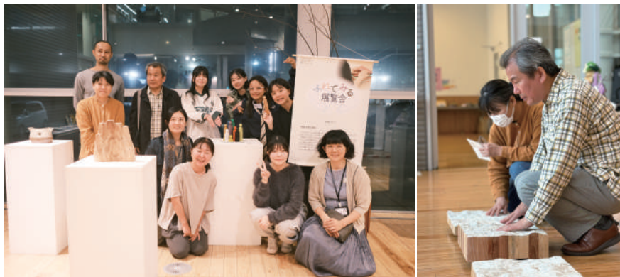
▲ 左-參與布展的參展者們攝於日本山梨縣圖書館。右-山梨縣立圖書館參觀導覽體驗。

藝術中心與日本國立山梨大學等單位共同舉辦《2025用手去看見世界－ふれてみる展覽會》，這是一場以「觸覺」為核心，提供視障者與一般民眾，經由觸摸感受藝術作品的質地與樣貌，同時搭配導覽資訊，突破傳統視覺的「觀」展體驗。而巡迴展最終站，來到可以遠眺富士山的日本山梨縣立圖書館，三個分立空間，展出超過50件臺、日、義、法雕塑作品與互動裝置，更特別邀請多國出版社，集結40本以上豐富多元的非視覺手作繪本，展現不同文化背景的作者，透過故事性陳述、立體化創意，將知識、觀念融入書籍，讓閱聽人透過觸覺，跨越語言及文化隔閡，發覺世界的不同觀看角度；也期待透過這樣的新形態展覽方式，實踐多元族群共同參與藝