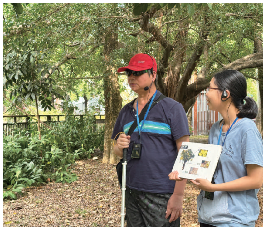
▲ 視障導覽員帶領民眾領略綠川之美

興大USR綠早興計畫為促進社會共融，攜手台中盲人重建院，推動具指標性的「非視覺導覽員培訓計劃」。培訓視障學員們突破視覺限制，運用敏銳的聽覺與觸覺，重新建構對河川動植物及水利工程的認知。透過專業的口述表達與觸覺記憶訓練，將艱澀的環境知識轉化為生動的導覽內容，並於10月31日「綠川生活日」，非視覺導覽員成功實現「角色翻轉」，自信地帶領社區民眾探索綠川賦予視障者展現專業的舞台，引導大眾關閉視覺、打開五感，體驗環境教育的溫暖與創新視角。