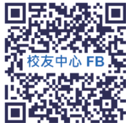
▲ 校友中心 FB

114年1月1日至11月24日止，校務基金捐款總額為98,790,721元，其中供學術單位之用57,553,848元(58.26%)、行政單位之用19,104,324元(19.34%)、獎助學金之用21,932,856元(22.2%)、不指定用途199,693元(0.20%)。捐款芳名錄公告於本校捐款網站( http://give.nchu.edu.tw/ )。