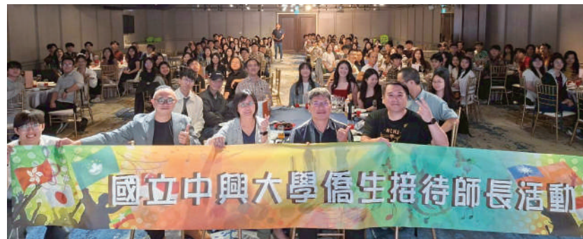
▲ 114學年度僑生接待師長活動

為使異地求學的大一新進僑生在興大能夠感受到家庭般的溫暖，學務處學生安全輔導室在11月13日於天圓地方婚宴會館舉辦「僑生接待師長餐敘活動」，藉由不同僑居地的民俗表演及人文風情的機智搶答，在歡愉的氣氛中拉近僑生與認輔師長距離，也使師長快速瞭解新生現況，協助儘早適應校園生活。