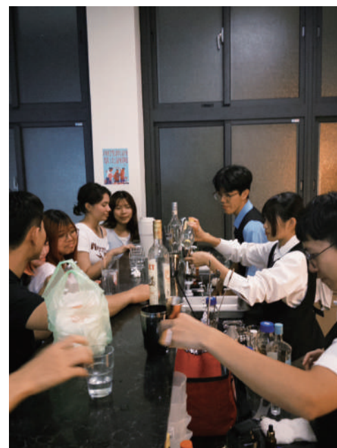
▲「興生吧」-學生親身體驗酒吧文化，了解調酒魅力。

在社員學習活動上，規劃社師社課與幹部社課，包含各類酒款介紹、風味知識、常見調酒技法等，期望社員能更全面地認識調酒文化。學期末也會舉辦成果發表，讓社員實際站上吧台，為客人調製酒品，藉由實作，檢視這一學期的收穫，並在成就感中更加投入調酒的世界。