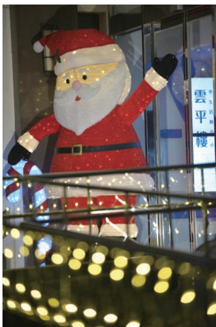
▲ 聖誕老人出沒在學生活動中心門口！在燈光點點陪伴下，用最歡樂的姿勢迎接每位路過的您。

此外，學務處課外組也將於12月11日下午5點30分辦理特別活動-「聖誕歐趴糖」！一起來領取屬於