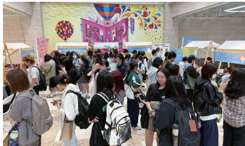
▲ 健諮中心與圖書館設置多元化攤位，邀請師生來一場豐富的心靈饗宴。

活動3小時共238人次參與，其中心靈映照、塔羅、紫微心算等攤位特別受同學青睞，在溫暖舒適的氣氛投入自我探索體驗後，皆強烈表示期待未來可以持續辦理此類市集活動、願意再次參加及推薦同學前來，希望能有更大規模市集等，反應熱烈。