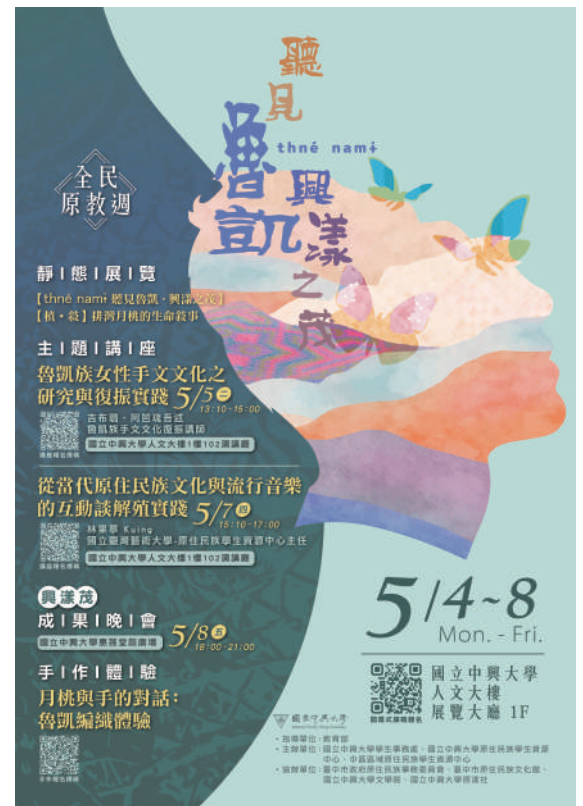
▲ 全民原教週展系列活動-開幕式、主題講座、手作體驗及學生成果晚會，歡迎大家共襄盛舉！

活動包含展覽、講座、手作體驗及學生成發晚會，引領參與者認識原住民族文化、生活智慧與價值，提升文化理解與敏感度。未來將持續推動相關活動，深化校內外對多元族群文化的認識。