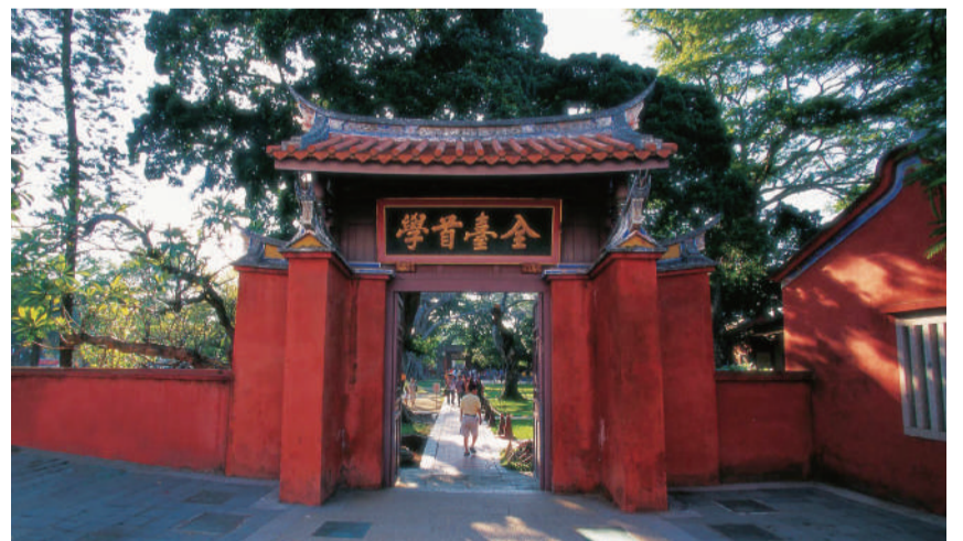
▲ 臺南孔廟。陳永華先生倡建，也是臺灣首座儒學教育機構。