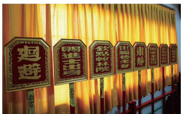
▲ 彰化曾維楨進士執事牌。「執事牌」為長方形木牌，下有木柄可供把握；考中進士返家祭祖謝神，將功名刻於木牌上豎立，被視為光宗耀祖的大事。

文發展緊密相連，期待以此作為開端，讓大眾對臺灣歷史文化有更深一層地瞭解，並提升對傳統文化的關注、傳承與交流，歡迎踴躍參觀。