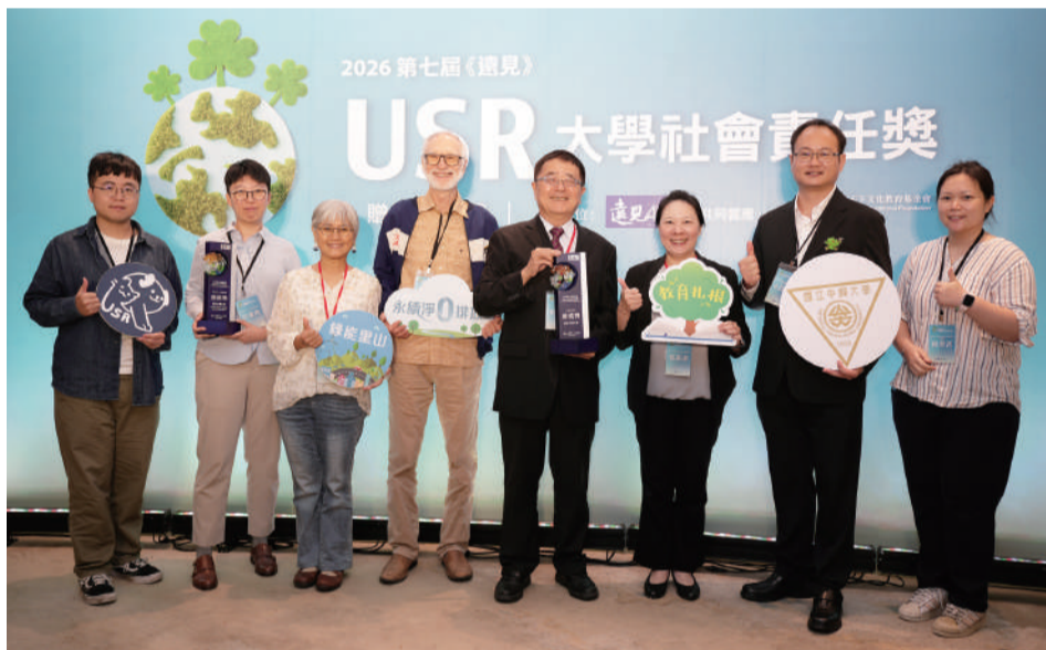
▲ 興大榮獲遠見「USR大學社會責任獎」四項大獎

「綠早雙脈·興水同心—兩河流域守護實驗室計畫」榮獲「在地共融組」績優獎。以興大校園「綠川」和「旱溪」兩大主要河川為實踐場域，透過以河川為場域的推動方式，能更加緊密鏈結興大師生與周遭鄰里的良好關係，共同推動綠早興生活圈永續發展。