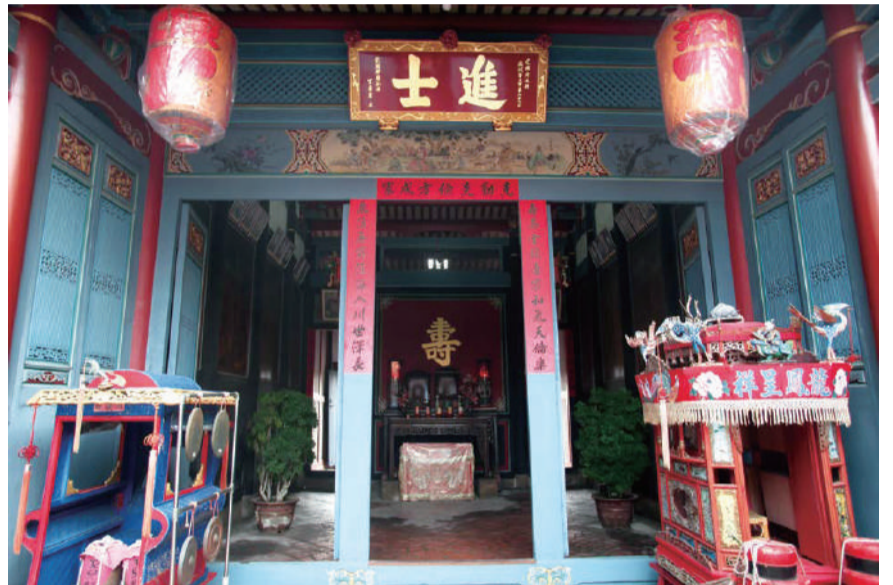
▲ 鹿港鎮著名的丁家古厝即是丁壽泉進士的生活居所，其為鹿港丁協源家族先祖丁克家的第六子，中進士後曾擔任彰化白沙書院山長，而今鹿港中山路丁家古厝仍保留當年的建築古貌，已為彰化縣之縣定古蹟，深具文化價值。

此次「臺灣進士專題展」聚焦於科舉制度在臺灣的設立與沿革，透過豐富的圖文資料考究，如大小金榜（黃榜）、進士齒錄、故居