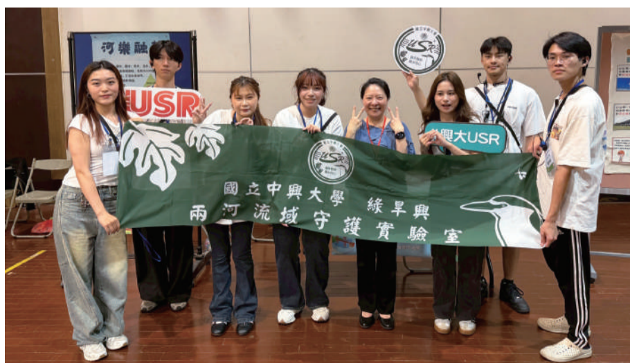
▲ 綠早興團隊師生前往向上國中推廣科學教育

活動過程中，學生們認真聽橋樑結構解說的小眼神，及燒腦拼湊木塊的團隊合作，到最後挑戰成功的大聲鼓掌，看到同學們如此投入，綠早興團隊師生也教得超開心。原來「橋」樑不只是連結河川兩岸，更是連結我們與科學的趣味橋樑！