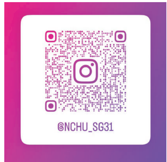
▲ 「興動528Hz」演唱會活動詳情

無論您是想感受青春的熱血，或是想與親友共度溫馨時光，雲平草坪已準備好迎接您的到來，在528Hz頻率中與我們一同揮手，共譜這段專屬於中興人的夏日樂章，讓愛與音樂在校園裡永恆迴盪。