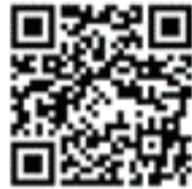
▲ 跨領域工作坊報名